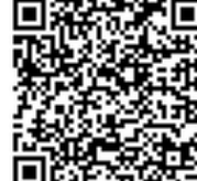
Spelvorm: geslacht en meervoudsregels