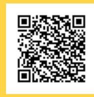
het mysterie van de goede leraar