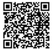
Kennis van Land en Volk